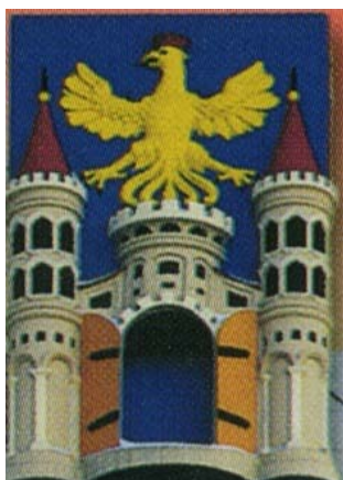
Le blason de Cieszyn

L'association CAMBRAI-CIESZYN-AMITIE a été créée officiellement le Lundi 5 février 2007. L'assemblée générale constitutive a eu lieu, à la Salle Jules Delcroix de la maison de quartier Saint Druon à Cambrai.